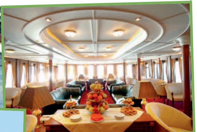
De Volga Dream werd nostalgisch maar superluxueus ingericht.

De volgende dag leggen we aan in Goritsy waar het klooster van Cyrillus van het Witte Meer ligt te schitteren in de zon. Het is een fotogeniek geheel van kerken en andere gebouwen die na jarenlang verval geleidelijk worden opgeknapt. Zo'n 350 km verder ligt Yaroslavl, een populaire toeristische route ten noordoosten van Moskou. Het hele centrum is Werelderfgoed. Je vindt er onder meer het mooie Transfiguratieklooster met gouden uivormige koepels. Ook niet te missen: de Profeet Eliaskerk waarvan de binnenzijde volledig is bedekt met fresco's en iconen. De fresco's zien er gloednieuw uit, maar ze dateren uit de 17de