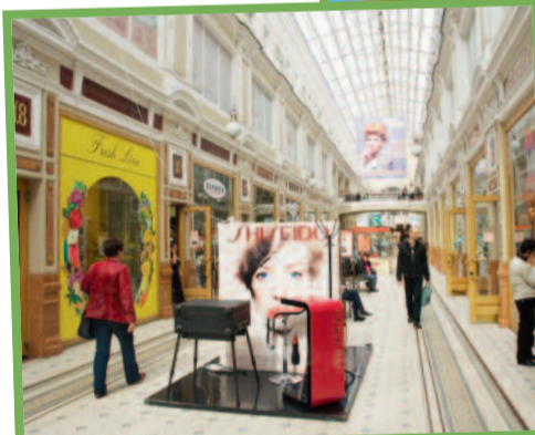
De boetieks aan de Nevski Prospekt in Sint-Petersburg zijn duurder dan in België.

spant de kroon met niet minder dan 22 volledige houten koepels waarvoor geen enkele spijker werd gebruikt.